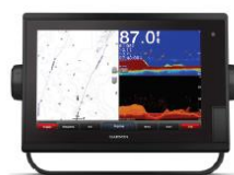
GPSMAP 7x2, 9x2 och 12x2 Touch-serien