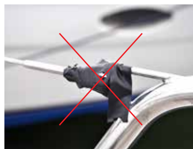
Ingen mer tejp på mantåget!