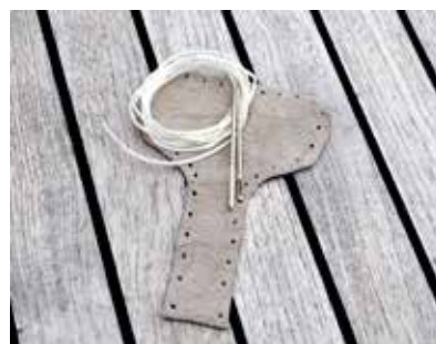
2 nålar i varje förpackning för att enkelt sy fast skyddet