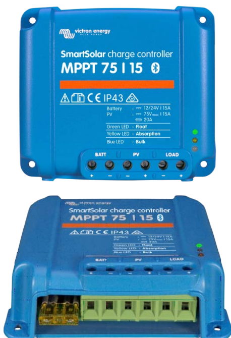
SmartSolar laddningsregulator MPPT 75/15